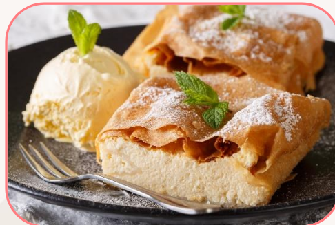
Quarkstrudel mit einer Kugel Vallilleeiscreme