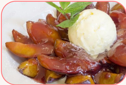
Walnusseiscreme mit heißen Zwetschgen & Sahne