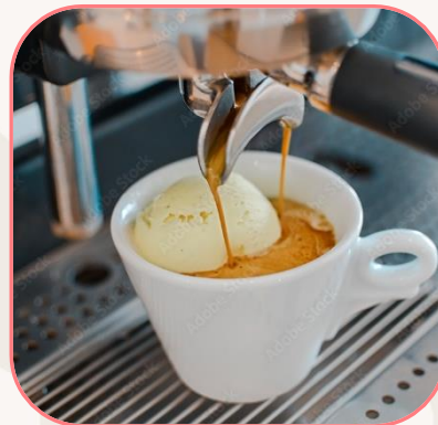
Affogato al caffè Espresso auf einer Kugel Vanille-Eiscreme