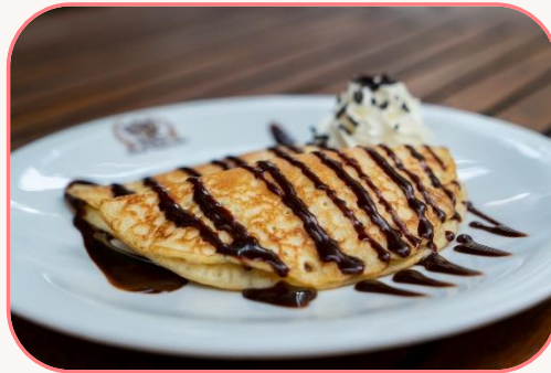
Gefüllte Topfenpfannkuchen mit einer Kugel Vanilleeiscreme & Sahne