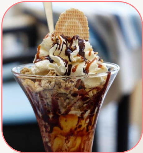
Nuss-Duell Nuss muss sein: Zwei Kugeln Walnuss-Eiscreme mit Eierlikör & Sahne