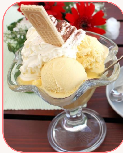
Schweden-Eisbecher Vanilleeiscreme mit Apfelmus, Sahne & Eierlikör