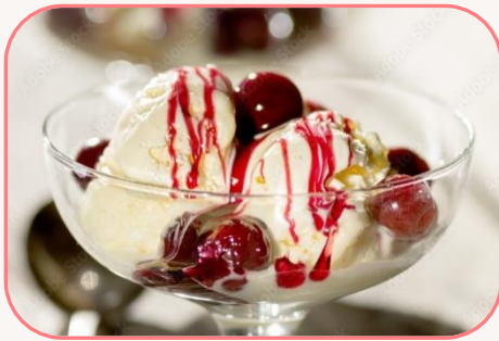
Heißes Früchtchen Zum Dahinschmelzen: Crème Vanilla flirtet mit heißen Früchten