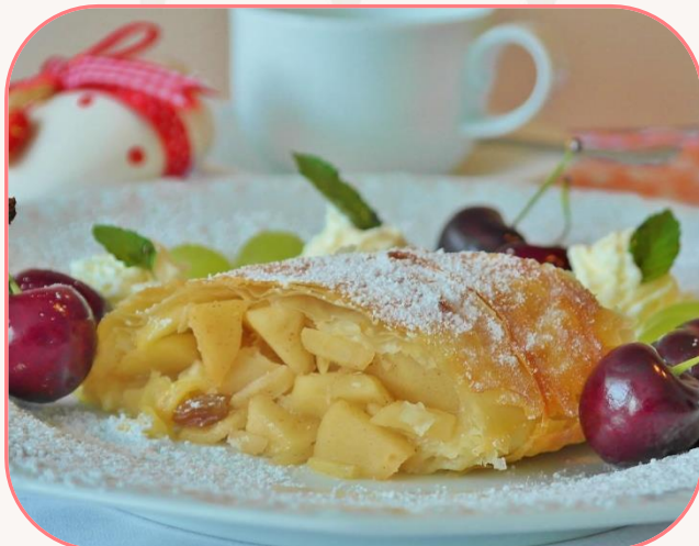
Apfelstrudel mit Sahne